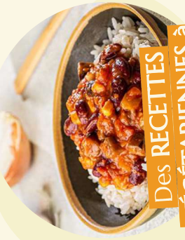
Des RECETTES VÉGÉTARIENNES à base de céréales et légumineuses