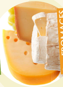
Des FROMAGES AUTHENTIQUES