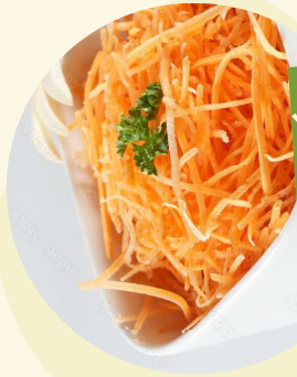
Des ENTRÉES SIMPLES et au goût des enfants