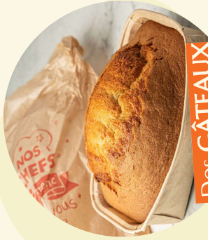
Des GÂTEAUX préparés par nos cuisiniers