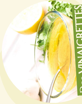
Des VINAIGRETTES élaborées par nos soins avec une huile de colza bio local