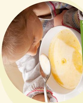
Des POTAGES préparés dans notre cuisine