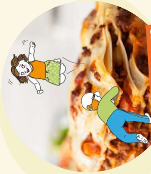
Des RECETTES SIGNATURES