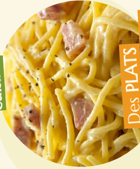
Des PLATS COMPLETS cuisinés par nos équipes