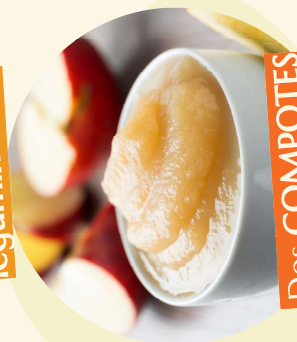
Des COMPOTES préparées avec des pommes locales